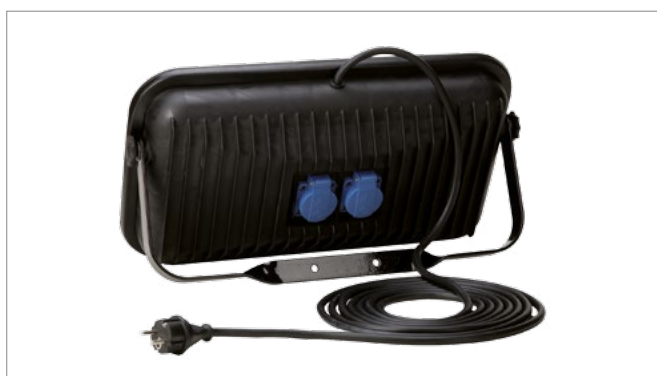
Magnum z dwoma gniazdami / Magnum with two sockets