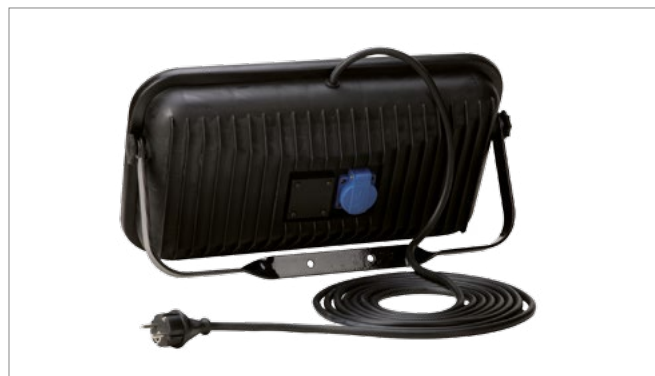
Magnum z jednym gniazdem / Magnum with one socket