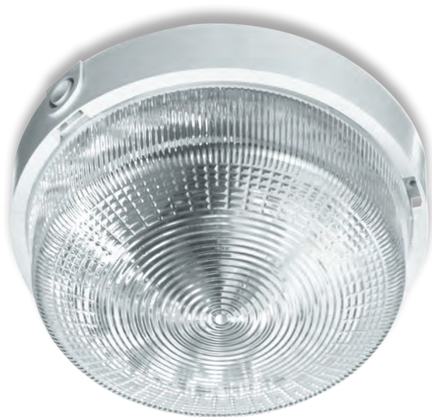
RONDO 1x100W OPAL